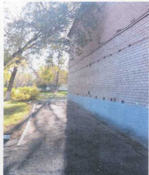
фото № 4