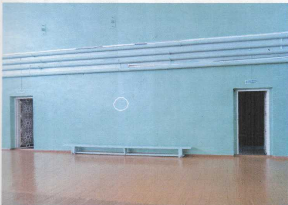
Фото № 9